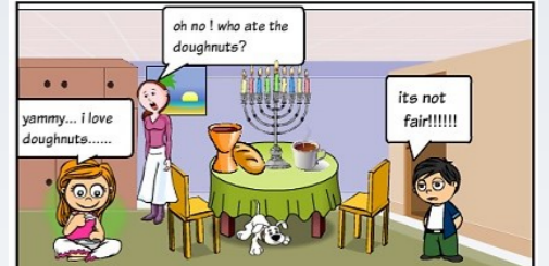
קומיקס - אלכס כיתה ה'